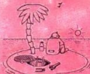
Рисунок В. АШМАНОВА