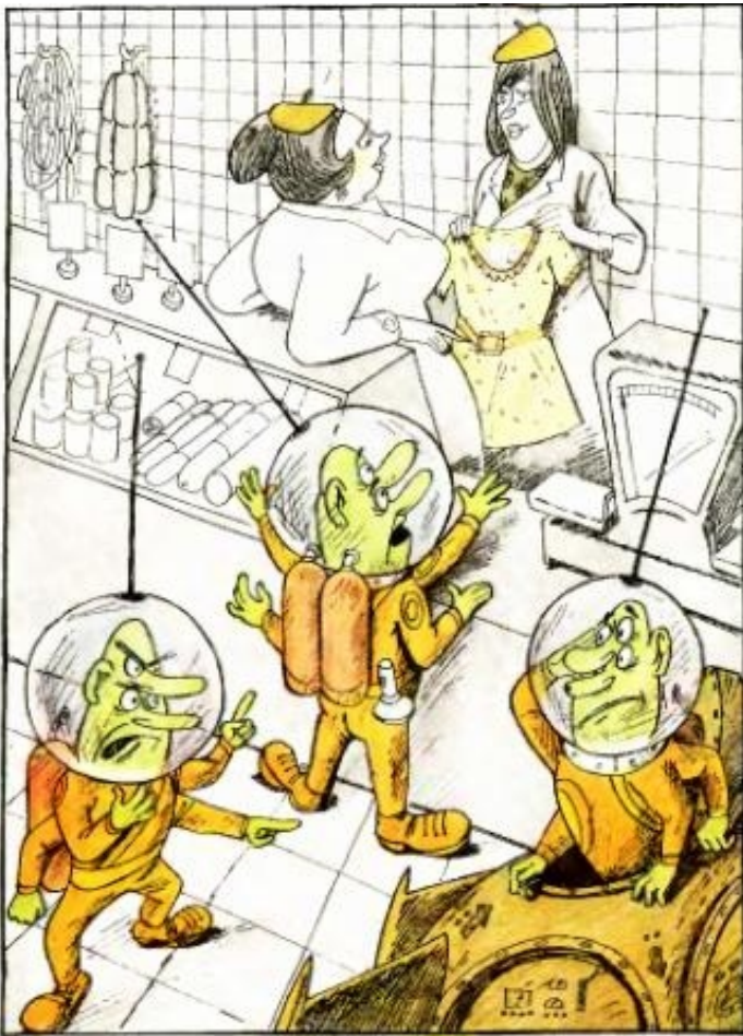
— Сообщил нашим, попытка контакта провалилась! Рисунок С. РЕПЬЕВА