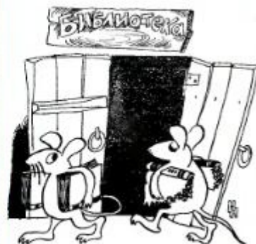
Рисунок Н. НУРМУХАНБЕТОВА