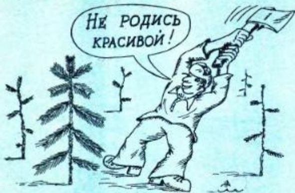
Рисунок Н. МАЛОВА