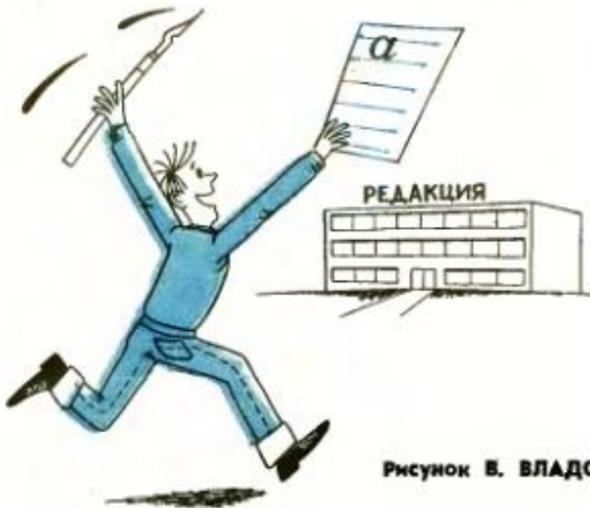
Рисунок В. ВЛАДОВА