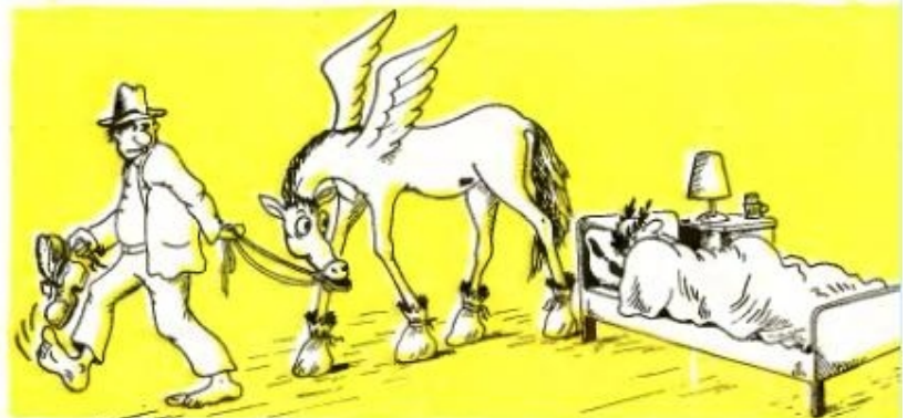
Рисунок А. УМЯ